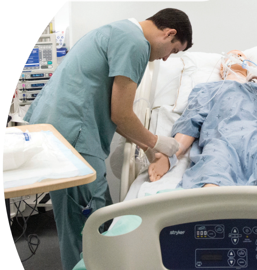
Photo démontrant une activité de simulation avec un mannequin pouvant reproduire les signes vitaux d'un humain.

De cet écosystème émergent les meilleures pratiques et l'atteinte des plus hauts standards de qualité et de sécurité des soins et des services offerts aux patients et leurs proches.