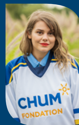
Béatrice Martin, alias Coeur de pirate, ambassadrice depuis 2019