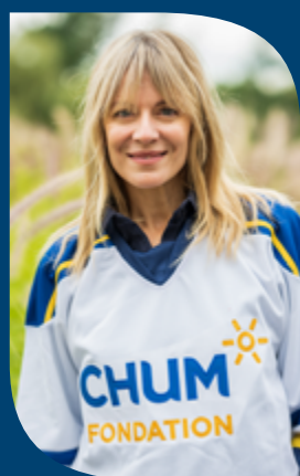
Véronic DiCaire, ambassadrice depuis 2018

Nous sommes choyé·e·s de pouvoir compter sur un porte-parole et sur des ambassadeur·drice·s qui ont à cœur notre plus grande richesse : la santé. Chacun·e à leur façon, ces personnalités engagées qui ont choisi de s'allier à notre cause contribuent à son avancement et à son rayonnement.